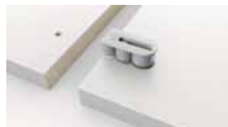
Usinage et montage simples