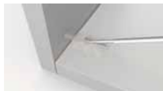
Assemblage rapide et solide